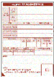
《見本：年金源泉徴収票》

なお、添付書類を提出される際は、マイナンバー（12桁の個人番号）が記載されていると受け取ることが出来ませんので、お手数ですがマイナンバーが記載されている箇所はご自身で隠すか、黒く塗りつぶす等をし、それをコピーしたものを提出してください。